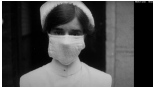
107 Alleen verplegend personeel droeg mondkapjes

Bij de opening van het 'R.K. Ziekenhuis Heil der Kranken' op 21 september 1918 was iedereen trots en blij. Het was een mooi en modern ziekenhuis met vier etages en zelfs een elektrische lift. En met plaats voor ruim 200 patiënten was het ruimschoots groot genoeg voor de inwoners van Oldenzaal. Niemand had gedacht dat binnen een paar weken het ziekenhuis zou uitpuilen met doodzieke en stervende patiënten. De Spaanse griep overviel Oldenzaal als een 'windvlaag des doods': bijna een kwart van de hele bevolking van ruim 7.000 werd ziek en binnen een paar maanden stond het dodental boven de honderd.