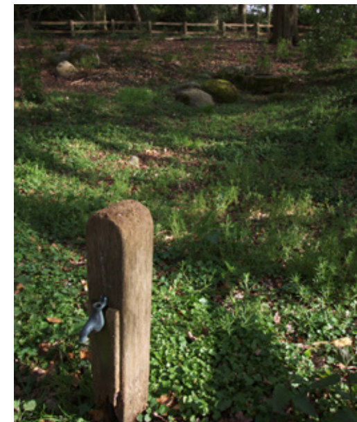
110 Het Kraenke, een natuurlijke bron op de helling van de Tankenberg, met een kraantje

De stuwwal Oldenzaal-Enschede, waarvan ook de Tankenberg een onderdeel is, bestaat vooral uit ondoorlatende grondsoorten als keileem en 'tertiaire klei'. Dat betekent dat alle regenwater zich verzamelt in de zandige bovenlaag en daarin zijn weg zoekt naar beneden. Halverwege en onderaan de berg komt het water op sommige plekken weer aan de oppervlakte in de vorm van natuurlijke bronnen. Het water van die bronnen is kristalhelder en is een groot deel van het jaar beschikbaar. Het water loopt via een netwerk van poelen, beekjes en grotere beken aan de westkant naar de Regge en aan de oostkant naar de Dinkel. De aanwezigheid van schoon drinkwater zal één van de redenen zijn geweest voor de eerste mensen om zich hier te vestigen.