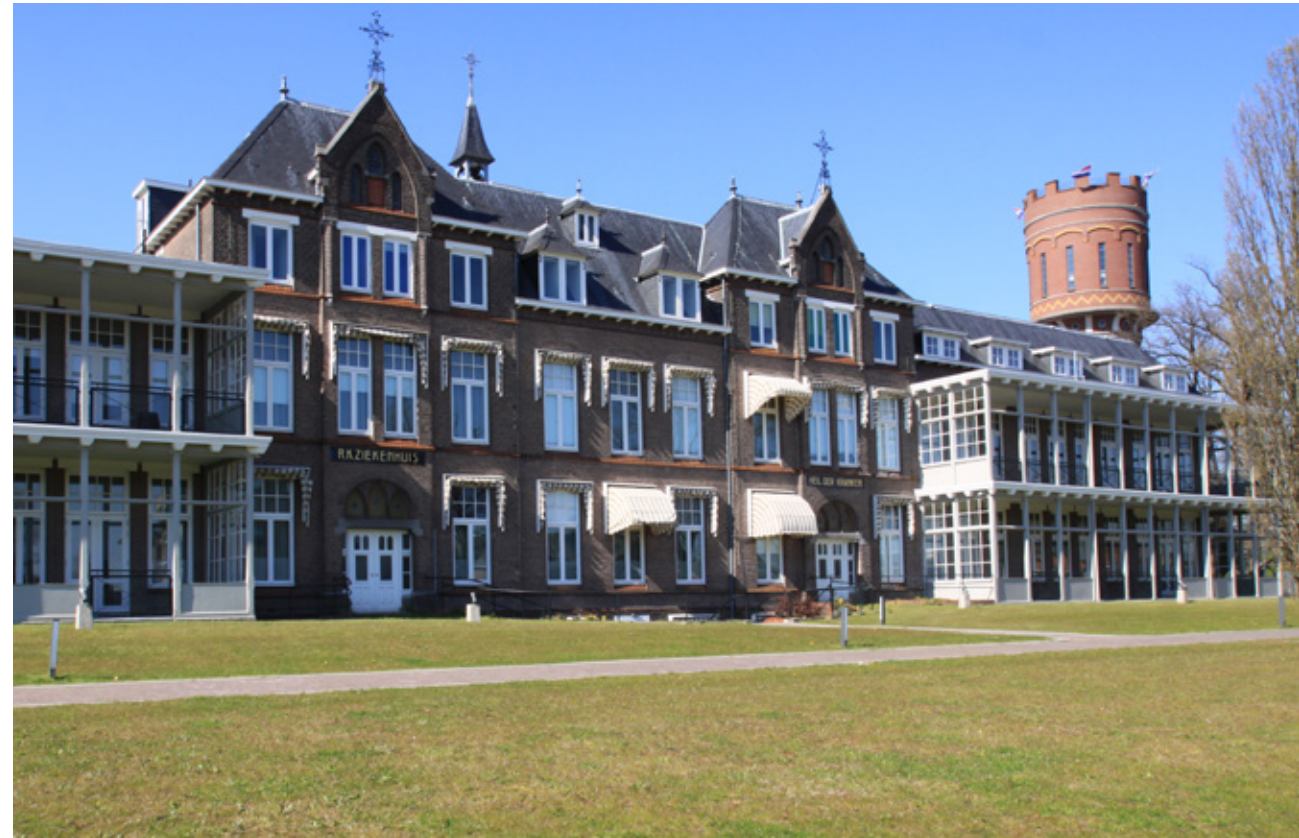
108 Het huidige 'Heil der Kranken' ziekenhuis, onderdeel van MST