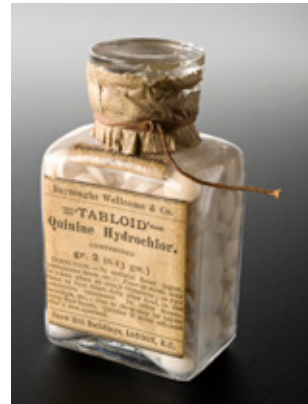
106 Kininetabletten tegen de koorts

Niet dat artsen veel konden betekenen voor hun patiënten. Artsen wisten in 1918 nog niet dat griep door een virus veroorzaakt werd, laat staan hoe ze zo'n virus te lijf moesten gaan. Ook tegen de daarop volgende bacteriële infecties (longontsteking) konden ze niet veel doen. Penicilline en andere antibiotica bestonden nog niet. Huisartsen adviseerden bedrust, warmte en ventilatie, en schreven aspirine en kinine voor om koorts te bestrijden.