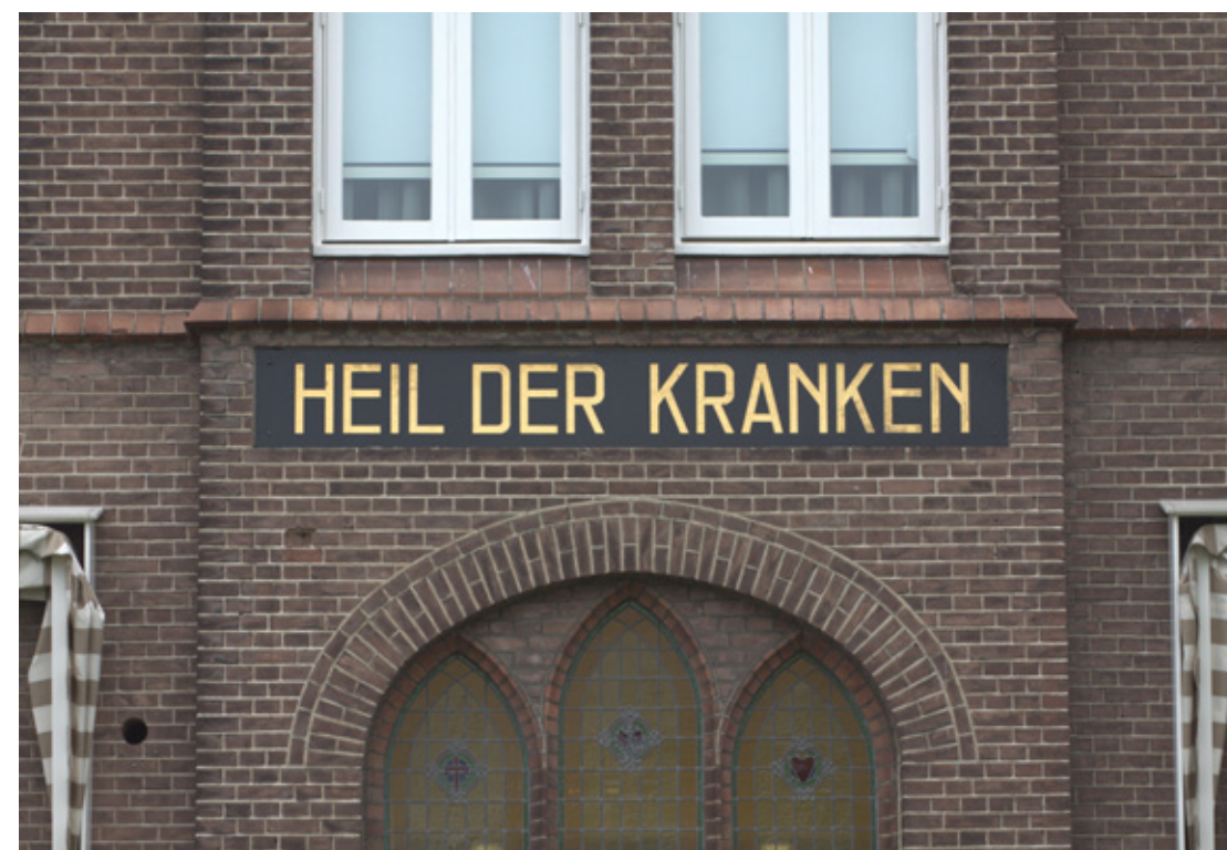
109 Oude voorgevel van het ziekenhuis uit 1918 Sinds de restauratie in 1995 staat de oude naam weer op de gevel

Het aantal besmettingen en sterfgevallen steeg in oktober explosief. Soms bleek de ziekte in enkele uren fataal. Een arts beschreef het ziekteverloop als volgt: "Aanvankelijk lijkt de ziekte op een gewone griep. Maar razendsnel ontwikkelen de patiënten een viskeuze